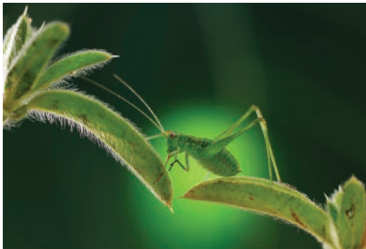
«Saltimbanqui», fotografia de Pepe Badia Marrero Concurs fotogràfic LXXXI