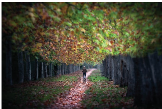
«Tardor» fotografies de Miquel Planells Saurina Concurs fotogràfic LXXXI