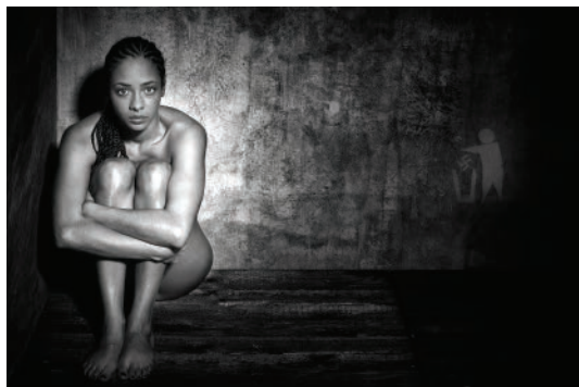
«Prou», fotografia de Felicià Sabater Rovira Concurs fotogràfic LXXXI