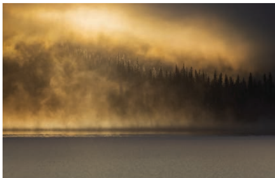
«Canadian Rockies» fotografies de Ricard Sánchez Gadea Concurs fotogràfic LXXXI