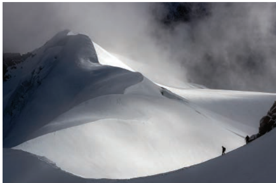
«Anem», fotografia de Ramon González Camps Concurs fotogràfic LXXXI