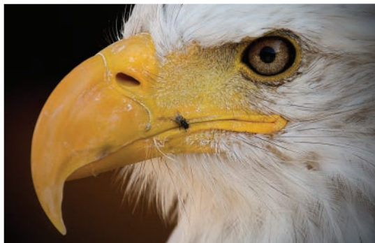
«Sense títol», fotografia de Marta Ribera Graells Concurs fotogràfic LXXXI