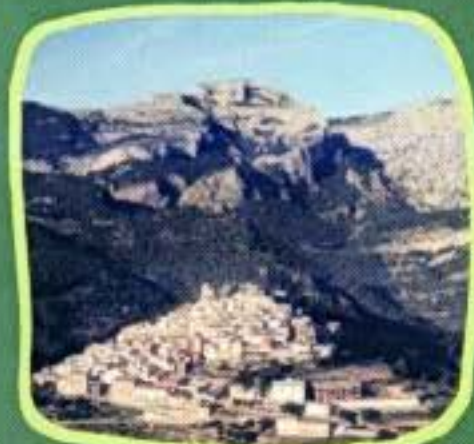
Vila de Paüls