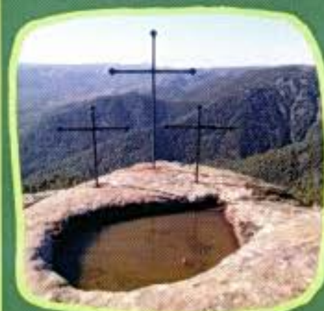
Mola dels Quatre termes