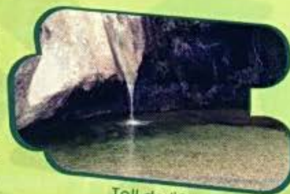
Toll de l'Ou

Pel camí de la Serra Major farem cap el Toll de l'Ou i l'ermita de Santa Magdalena, la catedral del Montsant. Cingleres, barrancs i grans paisatges ens acompanyaran en aquest tram.