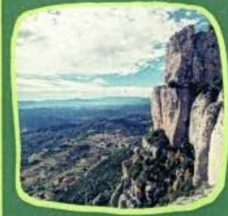
Cingles de Barrots (Montsant)