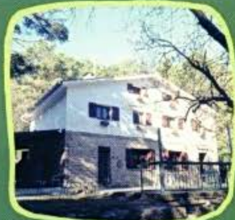
Refugi de Caro