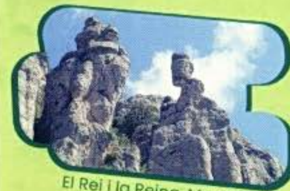
El Rei i la Reina, Montsant

Recordeu sempre el nostre lema: "Un jorn de sender, una setmana de salut".